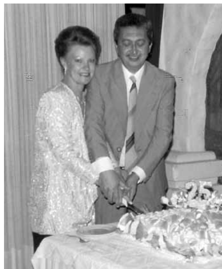
Comemoração dos 25 anos de casados